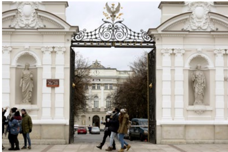
Kampus Główny Uniwersytetu Warszawskiego

Z takim nastawieniem rozpoczynasz semestr. Inauguracja przebiega szybko i wesoło, co bierzesz za dobry znak. Pierwsi znajomi z kierunku już zapraszają cię na integracyjne piwo. Jesteś wniebowzięty. Okazują się