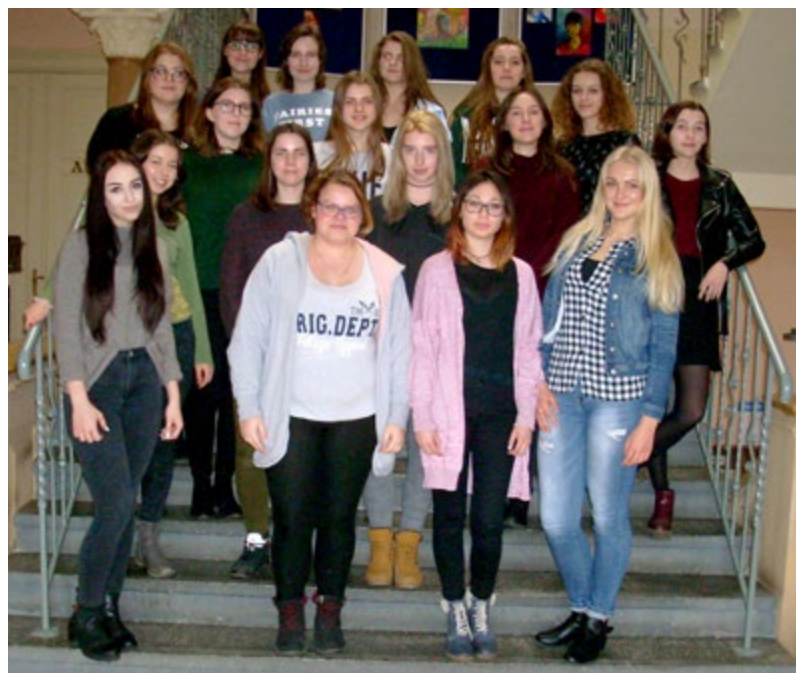
Grupa regionalna XXV edycji Międzyszkolnych Regionalnych Warsztatów Dziennikarskich.