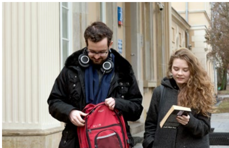
Przed wejściem do Wydziału Dziennikarstwa, Informacji i Bibliologii UW

„dobrymi ziomkami”. Naprawdę nie możesz się doczekać, aż to wszystko się rozkręci.