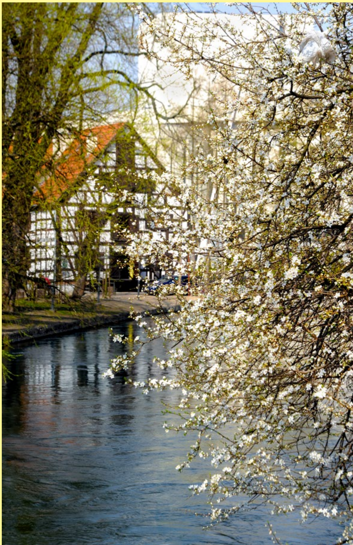
Bydgoszcz – przedwiośnie nad Brdą